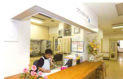
■ケアワークステーション