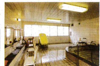
▲温泉となっています