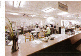
▲サービスステーション