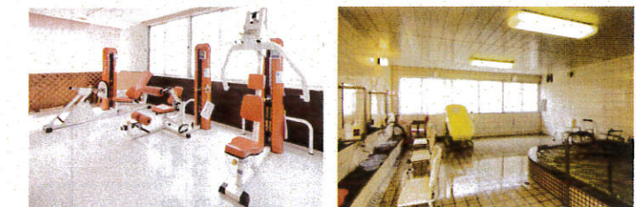
▲マシントレーニングによる運動もできます