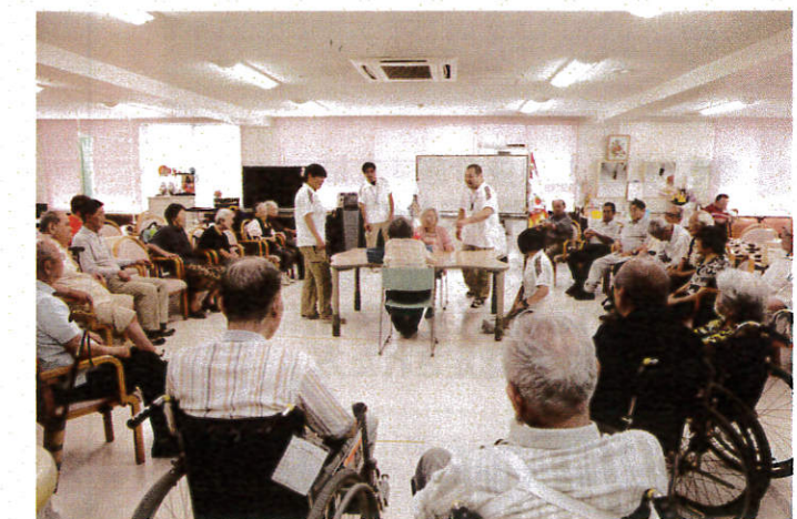
▲レクリエーションや季節の行事も充実

ご利用時間 月曜日～土曜日 午前9時30分～午後3時30分 ※ご利用回数は、個々のケアプランにより異なります。詳細はお問い合わせください。