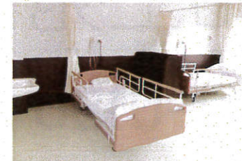
▲2人室(入所サービス時利用)