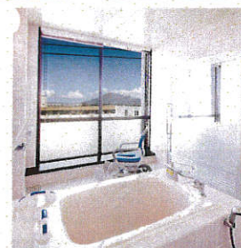
▲桜島をのぞむ、自然光が差し込む浴室

家庭的な雰囲気を大切にしながら、散歩や趣味など、入居者のニーズに、きめ細かいサポートでお応えしてまいります。