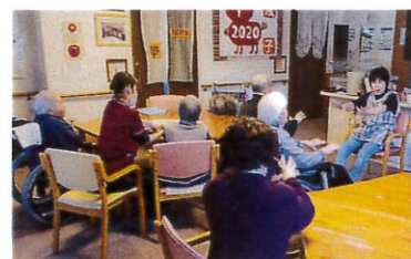
▲レクリエーション